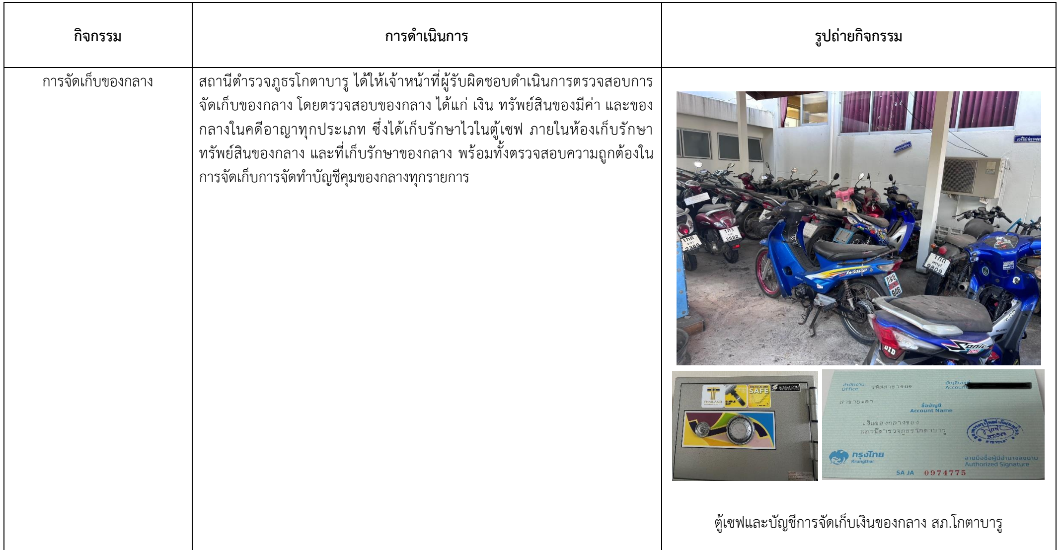
ตู้เซฟและบัญชีการจัดเก็บเงินของกลาง สภ.โกตาบารู